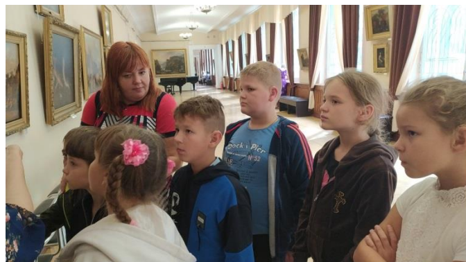
Викторина по произведениям А.С. Пушкина