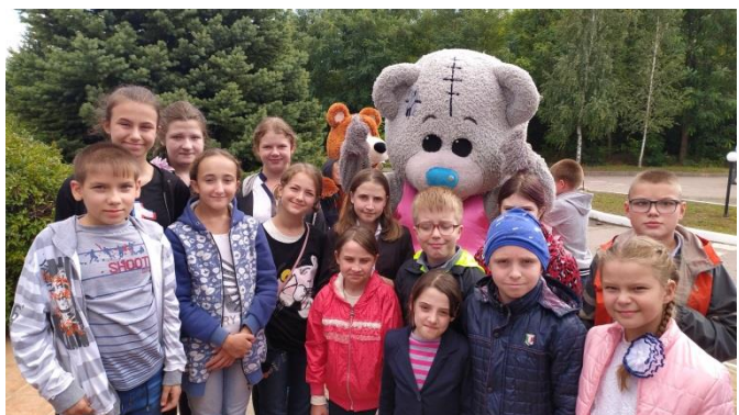
Экскурсия в детский развлекательный центр