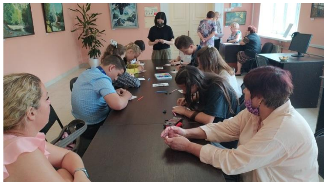
Мастер-класс «Художественная лепка»